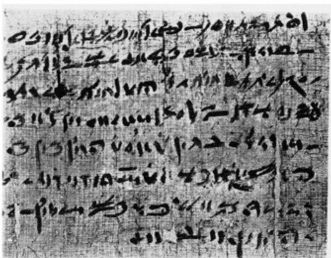
Nr. 10113, recto 1