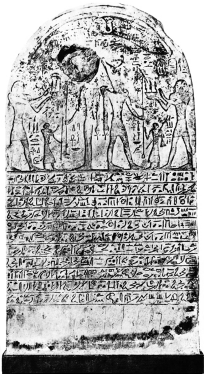
Stela donației lui Tefnakht din Muzeul de la Atena

(J. Capart, Recueil des Monuments Egyptiens , deuxième série, Bruxelles, 1905, planșa XCII)