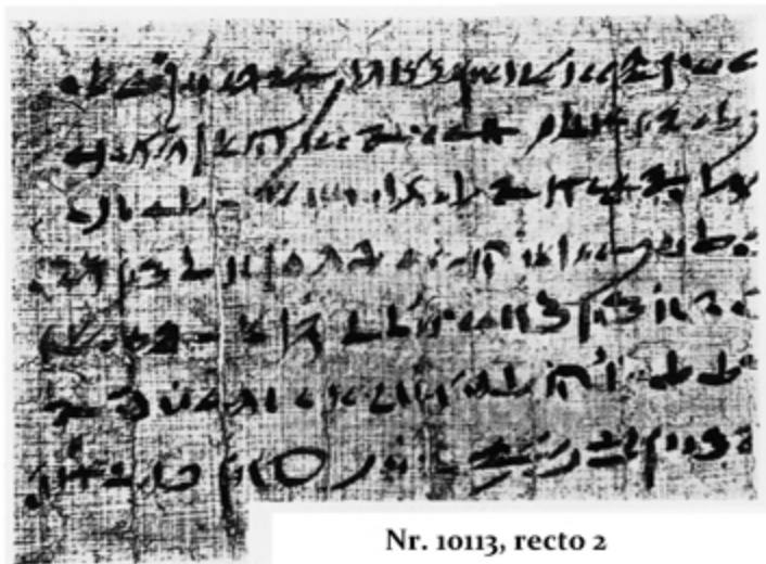
Nr. 10113, recto 2

(N. Reich, Papyri Juristischen Inhalts , Denkschriften Kaiserlichen Akademie der Wissenschaften in Wien. Philosophisch-historische Klasse, 55. Band, 3. Abhandlung, Wien, 1914, planşa I)